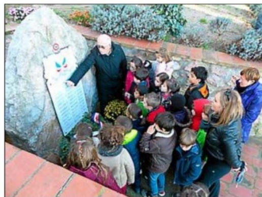
La visite au monument aux Morts, un moment fort.

tion de la volonté des membres de l'Amopa 66 à proposer des outils pédagogiques permettant aux enseignants de trouver des informations sur la Première Guerre mon-