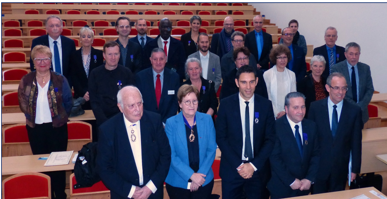
Les nommés et promus accompagnés de leurs marraines ou parrains